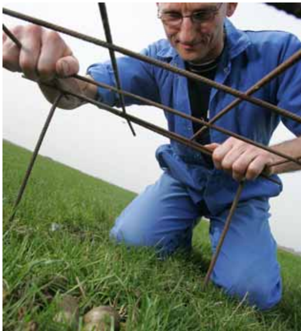
Agrarisch natuurbeheer (Noord-Holland)

DLG: € 42,2 mln. (w.v. € 10,7 mln. Rijk en € 31,5 mln. provincies).