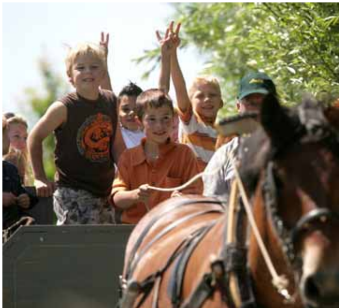
Trekpaarden voor melk en vertier (Zeeland)

Tot slot vindt u in dit jaarverslag informatie over de belangrijkste personele en managementaangelegenheden in 2006.