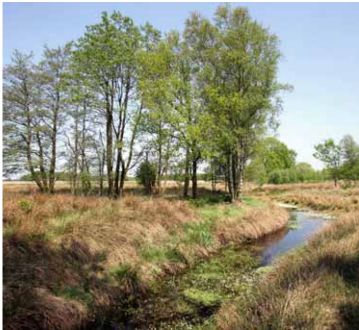
Herstel uniek cultuurlandschap (Drenthe)

In juni 2006 heeft een consultatiebijeenkomst plaatsgevonden, waarvoor alle relevante maatschappelijke organisaties waren uitgenodigd. Tijdens deze bijeenkomst is een presentatie over het Plattelandsnetwerk gegeven en is uitgebreid gediscussieerd over alle assen en keuzes, die gemaakt zijn voor de in Nederland in te zetten POP-maatregelen. In oktober 2006 heeft een schriftelijke consultatie plaatsgevonden over het eindconcept van het Programmadocument POP2. Maatschappelijke organisaties, belangengroepen, waterschappen en gemeenten is expliciet verzocht om op het concept te reageren en daarnaast is via de website van het Regiebureau POP aan alle belangstellenden de mogelijkheid geboden hun visie te geven.