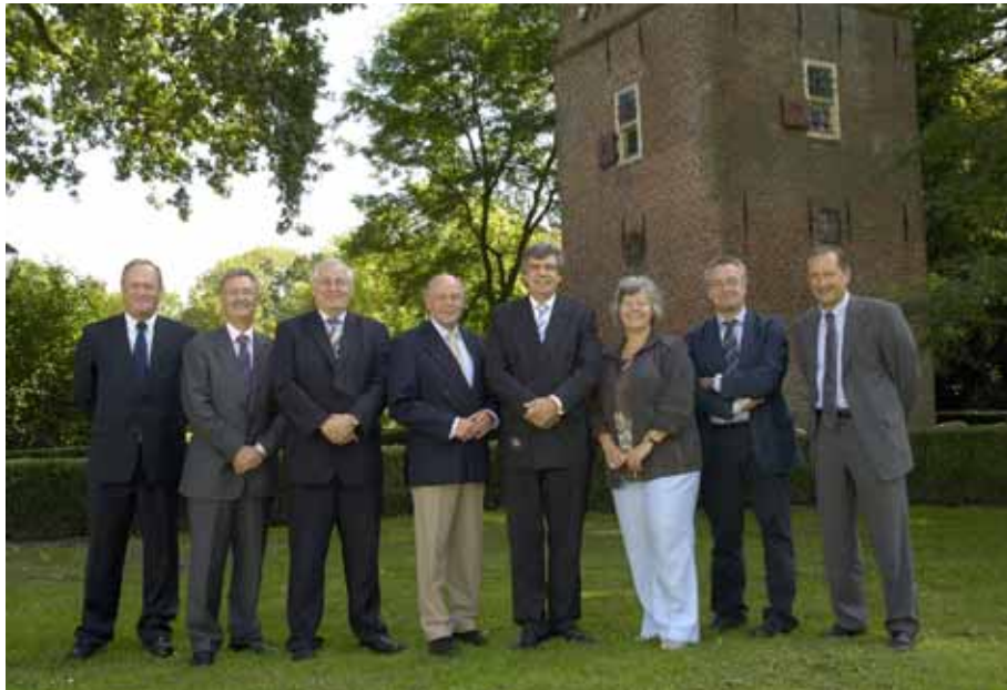
Het Comité van Toezicht POP Nederland 2000-2006

Daarnaast is het rapport "Minder en beter" besproken en geaccordeerd. Dit rapport is in 2005 opgesteld door Ecorys Nederland bv. Het bevat een ex post evaluatiekader voor POP1 met een aanzienlijke inperking van het aantal nationale evaluatievragen en -indicatoren. Waar streefwaarden ontbraken zijn de indicatoren alsnog voorzien van een kwantitatieve dan wel kwalitatieve streefwaarde.