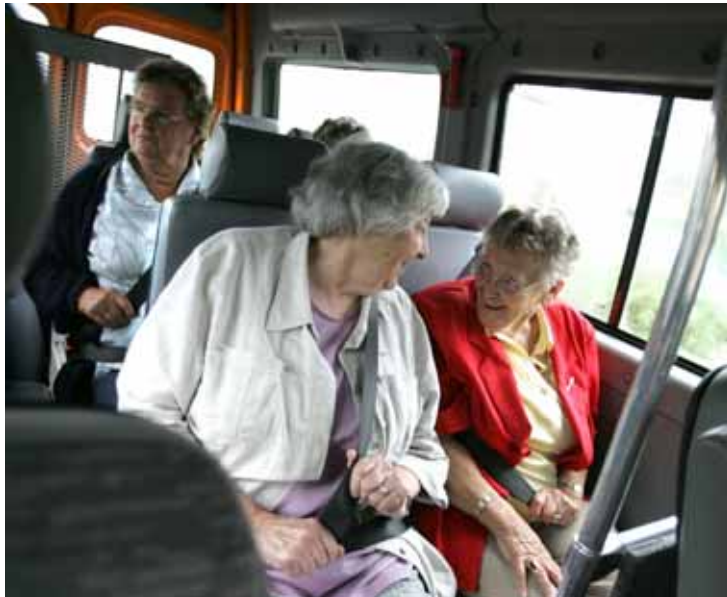
Plusbus: ouderen uit isolement (Friesland)

Het reguliere overleg tussen vertegenwoordigers van het Regiebureau POP en ambtenaren van DG AGRI en Plattelandontwikkeling over uitvoeringsaangelegenheden rond het POP is in 2006 gericht geweest op de totstandkoming van POP2. In 2006 is er negenmaal (in)formeel overleg gevoerd over onderwerpen, die POP2 betreffen, zoals de Nationale Plattelands Strategie (NPS) en het programmadocument POP2 voor de periode 2007-2013.